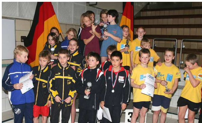
Hinter Berlin (Mitte) und vor Rostock (rechts) eroberten die Springer/innen vom Bundesstützpunkt Aachen in der Gesamtwertung Platz 2.